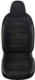
TKANINA DIGITAL JANE