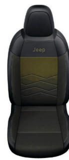
TKANINA ROBIN Z ŻÓŁTYM WYKOŃCZENIEM I WINYLOWYMI BOKAMI