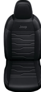
CZARNA SKÓRA Z SZARMI PRZESZYCIAMI (OPCJA)