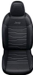
CZARNA SKÓRA Z SZARMI PRZESZYCIAMI (OPCJA)