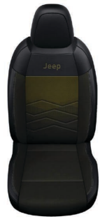
TKANINA ROBIN Z ŻÓŁTYM WYKOŃCZENIEM I WINYLOWYMI BOKAMI