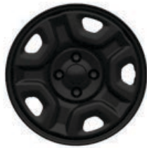
Stalowe obrycze kół 16" AVENGER (standard)

■ wyposażenie standardowe – wyposażenie niedostępne P Pakiet