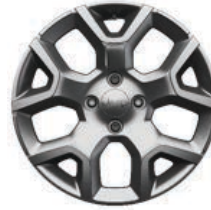
Aluminiowe obrycze kół 17" ALTITUDE (standard) LONGITUDE (opcja)