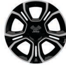
Aluminiowe obrycze kół 18" SUMMIT (standard) ALTITUDE (opcja)