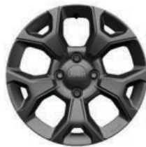
Aluminiowe obrycze kół 16" LONGITUDE (standard)