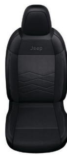
SZARA TKANINA ROBIN Z WINYLOWYMI BOKAMI