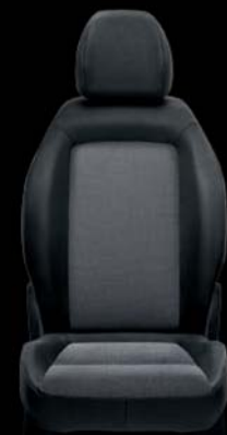
Tapicerka materiałowa w kolorze czarno-szarym