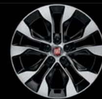
Felgi aluminiowe 16" z diamentowym szlifem