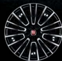
Felgi stalowe stylizowane 16"