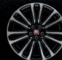
Felgi aluminiowe 17" z diamentowym szlifem