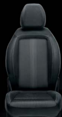
Tapicerka materiałowa w kolorze czarno-szarym z podwójnymi przeszyciami