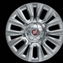
Felgi stalowe 15" z kołpakami