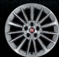
Felgi aluminiowe 16"