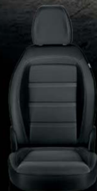
Tapicerka materiałowa w kolorze czarnym z podwójnymi przeszyciami