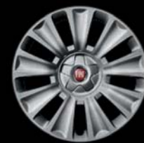
Felgi stalowe 16" z kołpakami