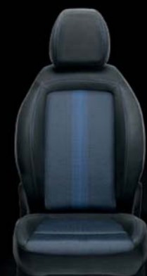
Tapicerka materiałowa w kolorze czarno-niebieskim z podwójnymi przeszyciami