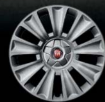
Felgi stalowe 16" z kołpakami