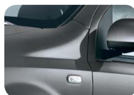
695 Szary Electrocash