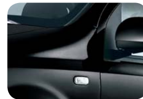
876 Czarny Crossover