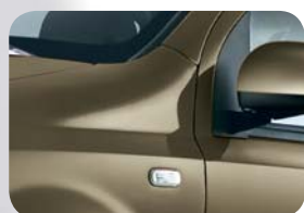
633 Beżowy Cumbia