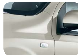
612 Szary Minimal