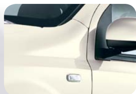
268 Biały Bossa Nova