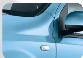
952 Niebieski Volare