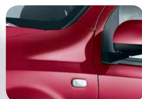
705 Czerwony Twist