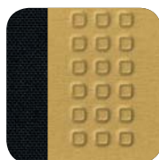
671 Vision czarno-żółty