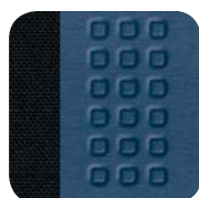
638 Vision czarno- niebieski