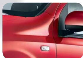
111 Czerwony Pasodoble