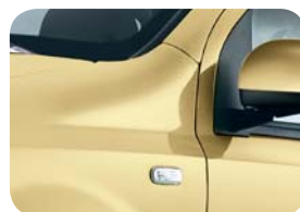
541 Żółty Mambo