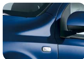
475 Niebieski Rock'n'Roll