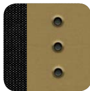
098 Glam czarno- beżowy