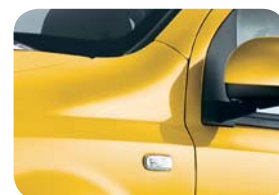
509 Żółty Tropicalia