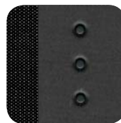
100 Glam czarny