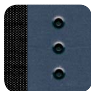
094 Glam czarno- niebieski