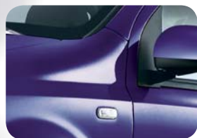
154 Fioletowy Tribal