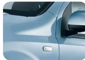
792 Błękitny Surf